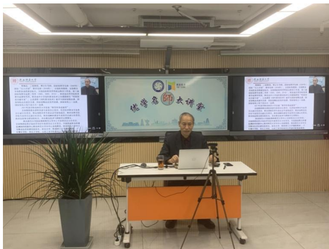
陕西师范大学、国家教学名师傅钢善教授

1月13日西北联盟举办名师大讲堂线上讲座活动，此次活动邀请了陕西师范大学二级教授、博士生导师、国家教学名师（2009年）、国家“万人计划”教学名师傅钢善教授作关于“信息化技术环境下以学为本的信息化教学设计”的专题讲座，共有350余位高校教师在线上聆听了此次报告。