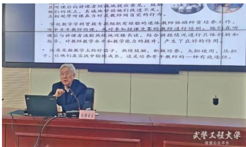
国家教学名师 西安交通大学马知恩教授

教学组织管理能力提升，聚焦教学创新和教学团队建设等，历时7天，安排辅导讲座16次、观摩示范课2次、教师工作坊3次、组织专题讨论及现地参观5次，听取了高校专家名师的报告，并进行了专题讨论、示范教学。