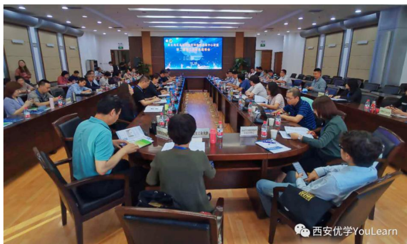
2020年常务理事大会会议现场

2020年9月18—19日，西北地区高等学校教师教学发展中心联盟以线上、线下相结合的形式在西北农林科技大学召开西北地区高等学校教师教学发展中心联盟2020年会。大会邀请新加坡南洋理工大学洪华清教授、美国密歇根大学由继禹教授、马里兰大学杨军教授、山东大学教师教学发展中心副主任李赛强分别作报告。西北农林科技大学副校长罗军，西安交通大学教师教学发展中心主任徐忠锋、西北联盟理事长，西安交通大学鲍崇高教授、西北联盟副理事长参加此次会议并致欢迎辞。大会由西北大学教发中心石建国主任主持。