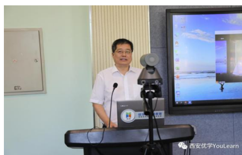
2020年常务理事大会线上报告现场

此次年会通过新途径新方法指导教发中心工作人员及教师如何有效整合教学资源 and 互联网技术，充分利用信息化教学的优势，结合学校实际情况，进一步推动高校线上线下教学的有效融合，进而提升教师教学效果。