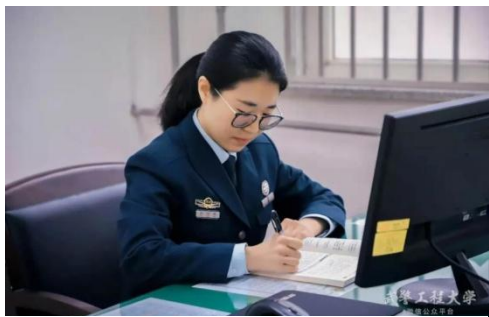
装备管理与保障学院 军事财务教研室

二是以教学为中心，抓教学促内涵。课程思政，将忠诚教育融入课堂，结合现代教育技术，继续开展基于电子书包、云平台的线上线下混合式教学模式探索。三是密切师生关系，实现教学相长。以学员为中心，借助俱乐部活动、本科生导师制等载体，充分了解学员的所思所想，站在学员的角度思考教学，形成教与学的良好氛围。四是靠拢部队、着眼前沿，实现科研持续发展。着眼部队网络空间安全态势建设的新前沿，树立“科研促进教学、服务部队”的鲜明导向，扎实搞好现有国家级项目 1 项、军队级项目 3 项研发工作，积极拓展新的军事课题。