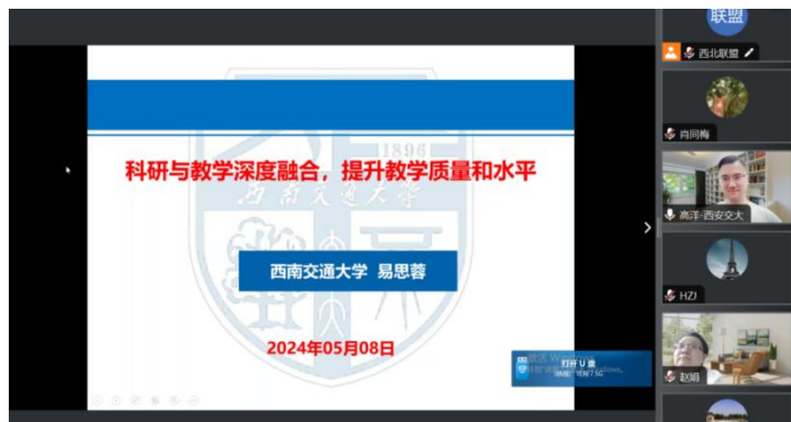
西北联盟举办“在线名师报告”

5月9日，西北联盟举办“在线名师报告”活动，邀请国家教学名师、西南交通大学易思蓉教授作题为“科研与教学深度融合，提升教学质量与水平”的线上主题报告。西安交通大学教师教学发展中心副主任高洋主持，联盟高校415位教师线上参加活动。