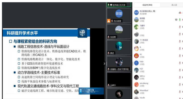
国家教学名师、西南交通大学易思蓉教授作报告

易教授还讲到“教学也是学术研究”。她结合自己 36 年来的教学实践，介绍了自己如何从深入了解课程理论体系的理论出发，不断琢磨问题、方法、概念、公式、参数，列举了自己如何从《铁路选线》课程中的曲线公式一个参数研究，开启了后续一系列科研、教学、现场实践，互相渗透、互为补充的工作实践。她说，通过教学，会不断发现科研的空间和深度，只要科技在发展，问题始终存在，研究始终存在，教学内容和课程体系就会不断完善、不断更新。