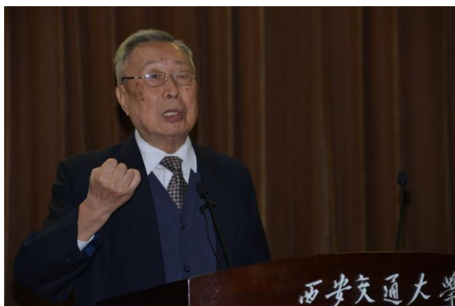
谢友柏院士作报告

谢友柏院士指出，人才二字的内涵是“要成才，先成人”，他希望青年教师做一个有道德自觉的人。他强调，个人的利益不能影响国家、集体的利益，交大西迁时，先辈们自觉、自愿从上海奔赴西安，不畏艰苦，不断奋斗，在农田上建起一所高等学府，这是一种内在的、重要的精神与文明。谢友柏希望青年教师能发扬传统，树立目标与理想，为祖国建设、学校发展做出贡献，并积极引导学生做一名有道德、有文化的人，培养一批继承、传承中华文明的年轻人。