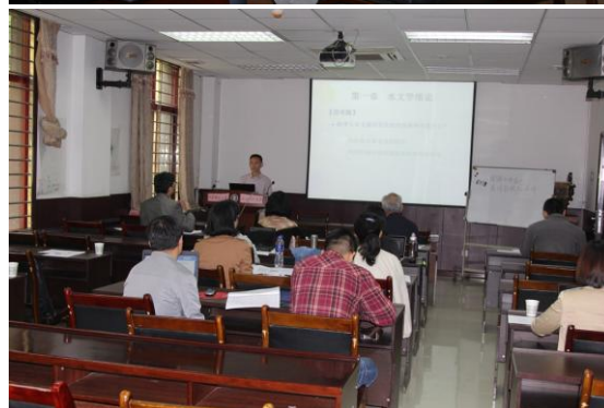
新入职教师分组试讲，专家点评