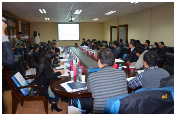
西北联盟第一届第二次常务理事会议

在西北联盟“名师西部高校行”活动期间，11月15日，在兰州大学逸夫科学馆召开了西北地区高等学校教师教学发展中心联盟第一届第二次常务理事会议，21个常务理事单位的35位代表参加会议。会议由西北联盟