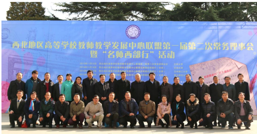
西北联盟第一届第二次常务理事会议合影

会议提出 2016 年西北联盟将继续举办“名师西部高校行”专题活动，发挥名师引领作用，进一步做好优质教育教学资源推广应用工作，提高西北地区高等学校教师教学能力，推动西北地区高等学校教学质量提高。