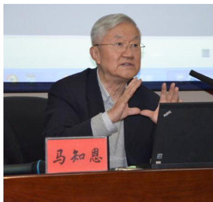
国家教学名师马知恩教授作报告

16日，“名师西部高校行”首场报告在兰州大学举行。马知恩教授年逾八十，依然精神矍铄，声如洪钟。报告以“怎样上好一堂课”为题，首先和大家分享了自己从事高校教学60年的一些见闻和心得体会，他指出讲好一堂课的两个前提：对教学高度的敬业精神，坚实的业务基础和一定