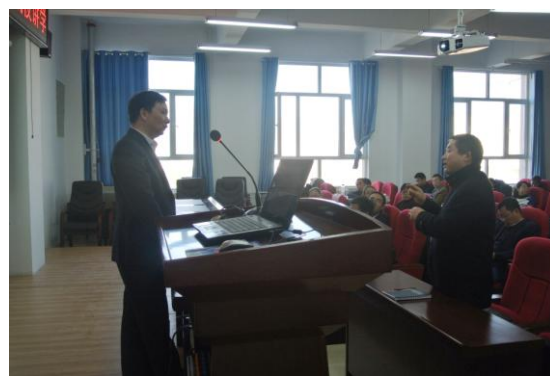
国家教学名师赖绍聪教授报告会现场