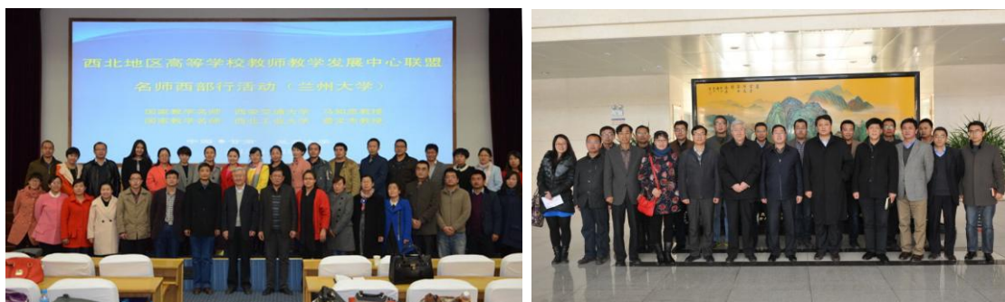
兰州大学（左）、天水师范学院（右）报告会后部分教师与名师合影

此次“名师西部高校行”活动还有青海师范大学、西北民族大学、甘肃农业大学、甘肃中医药大学、甘肃钢铁职业技术学院、兰州财经大学、兰州文理学院、兰州工业学院、兰州职业技术学院、陇东学院等院校选派教师参加，活动受到各院校一致好评，会后名师与参会教师合影留念。