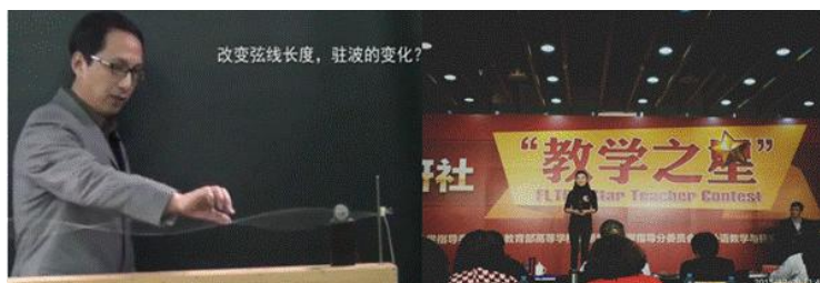
全国高校微课教学比赛 刘丹东老师 外研社“教学之星”邹郝晶老师

同时，通过基础课质量建设等工作促进基层教学组织的构建与强化，诸多教师在基础课改革专项中将信息技术与教育教学深度融合，开发了优质教学资源。正是基于中心与学院对教师的多元支持，相关竞赛成绩逐渐显现，在中国外语微课大赛中来自大学英语教学团队的钱希老师一举拿下唯一的特等奖奖项，邹郝晶老师、楚建伟老师则分获二等奖和三等奖。此外，邹郝晶老师还曾获外研社“教学之星”大赛一等奖；来自大学数学教学团队的赵小艳老师、吴慧卓老师在全国高校数学微课程教学设计竞赛中连续蝉联两届一等奖；而来自大学物理教学团队的刘丹东老师则在全国高校微课教学比赛中荣获二等奖。这不仅提高了教师教学能力，更体现了教书育人的荣誉感和使命感，为广大一线教师树立了典范，并最终为此次我校在分析报告中的排位提供了重要的数据支撑。