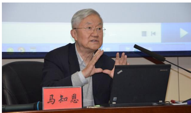
马知恩教授作报告

11月19日，在兰州进行西北地区高等学校教师教学发展中心联盟“名师西部高校行”活动的西北联盟理事长、国家级教学名师、西安交通大学教师教学发展中心主任马知恩教授一行3人应河西学院邀请前往，交流教师教学发展工作并作教学学术报告。