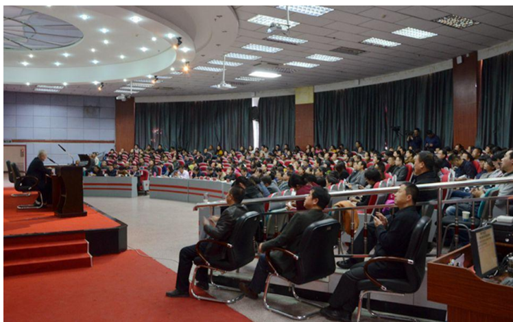
河西学院报告会现场