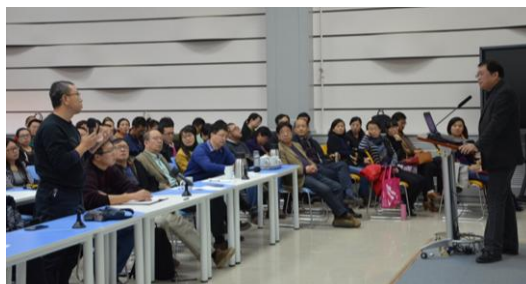
回答青年教师提问

学生，高标准要求自己，养成良好的习惯；要通过知识的传授培养学生科学思维方法和能力；要善于启发引导，注意师生互动；要更新教育理念，改革教学方法，做好板书和PPT的相互配合，注意现代信息化教学技术的适当应用和有效利用网络资源。报告结束后，马知恩教授、葛文杰教授与青年教师就教学中的问题进行了交流，回答了他们的提问。